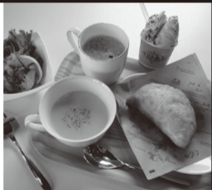
↑「イタリア人の休日セット」前菜orスープ

リスの森のジェラート“ダブル”付のお得なセットがこの夏おすすめ♪日替わりの前菜や人気のスープ、イタリアビールもご用意しています！